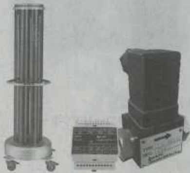
紫外線殺菌装置 (左) ・ グリースフローセンサー (右と中央)

食品工場の省人化、省力化に貢献する装置「フードカッター」を開発し、市場投入しました。食品業界向けの展示会においても好評で切断時の温度管理や異物混入対策など、同業界ならではの個別ニーズに定めるべく、技術開発を続けています。製品搬送の自動化ラインと併せ、トータル提案を行っています。 機械加工後のバリ取りや表面の仕上げ向けなどで、パレル槽を高速自公型高速遠心パレル研磨機」も開発しました。パレル研磨機」も開発しました。パレル研磨機」も開発しました。パレル研磨機」も開発しました。 パレル研磨機」も開発しました。パレル研磨機」も開発しました。パレル研磨機」も開発しました。パレル研磨機」も開発しました。