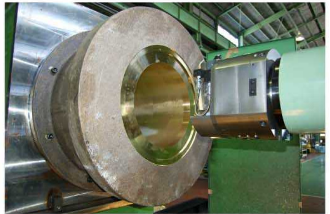
加工物とフェーシングヘッド