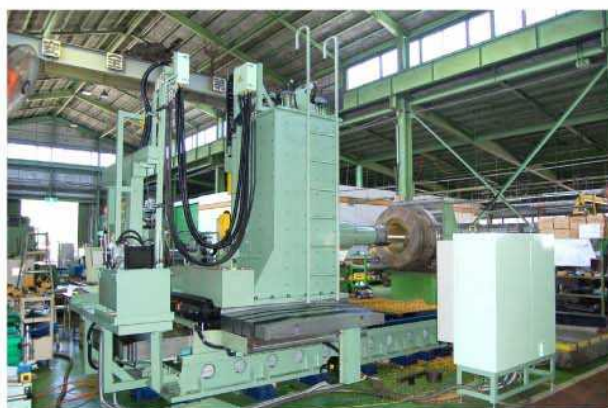
機械後面、電気制御装置