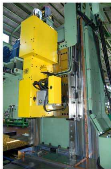
ヘッド上下ローラーガイド