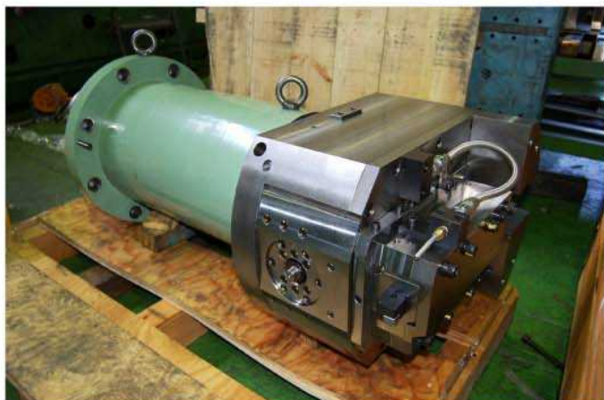
中型フェーシングヘッドST-80mm