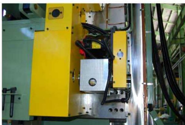
フェーシングストローク送り駆動モーター