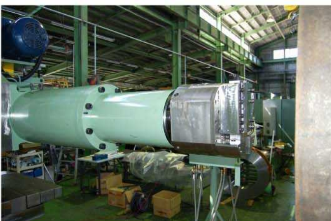
小型フェーシングヘッドST-55mm