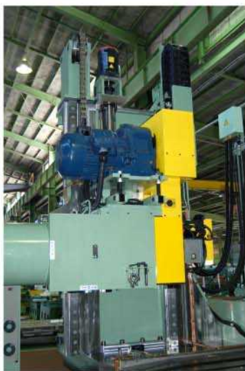
主軸ヘッド部、ヘッド上下送り駆動モーター