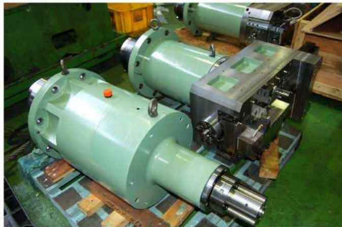
ドリル、タップヘッド 端面用フェーシングヘッド