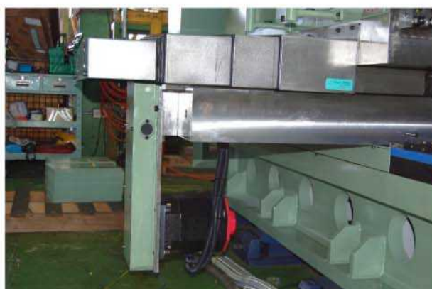
コラム左右送り駆動モーター