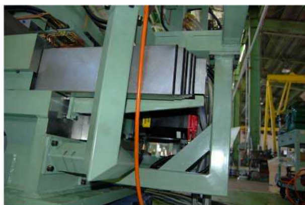
コラム前後送り駆動モーター