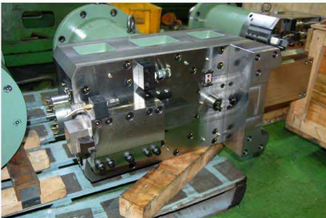
端面フェーシングヘッドST-270mm