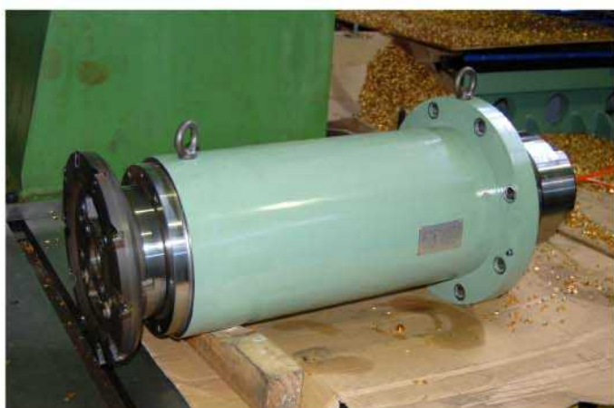
ミーリングヘッド