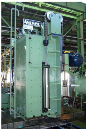
カウンターバランス用油圧シリンダー