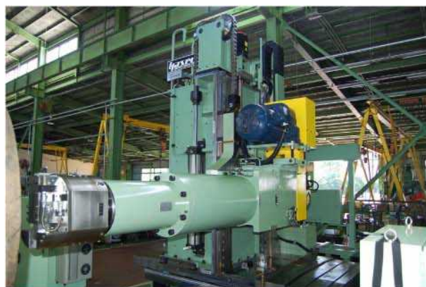
コラム、主軸ヘッド部