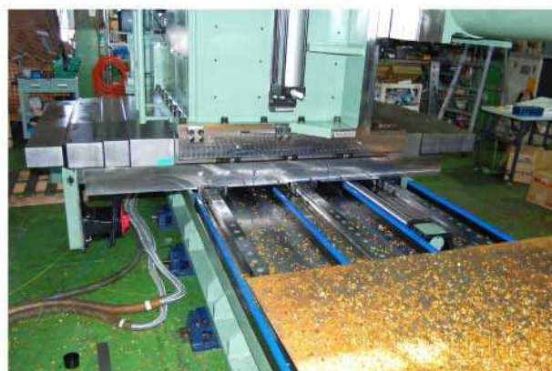
コラム前後-ローラーガイド