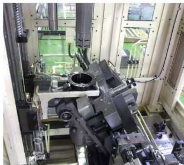
同じく上側より見る