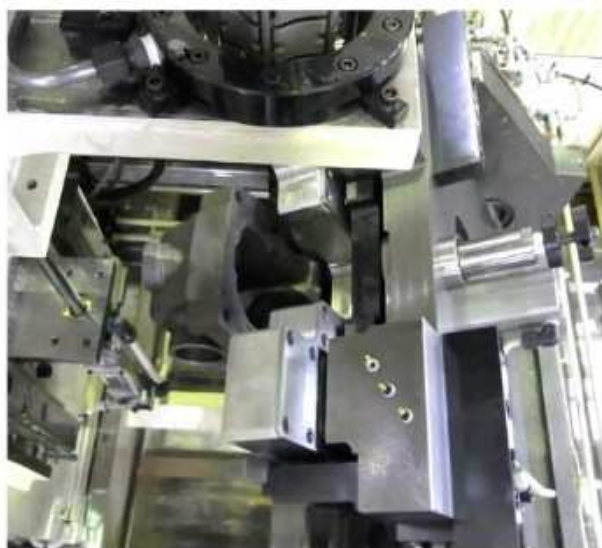
作業位置にセットされた加工物—上側より見る