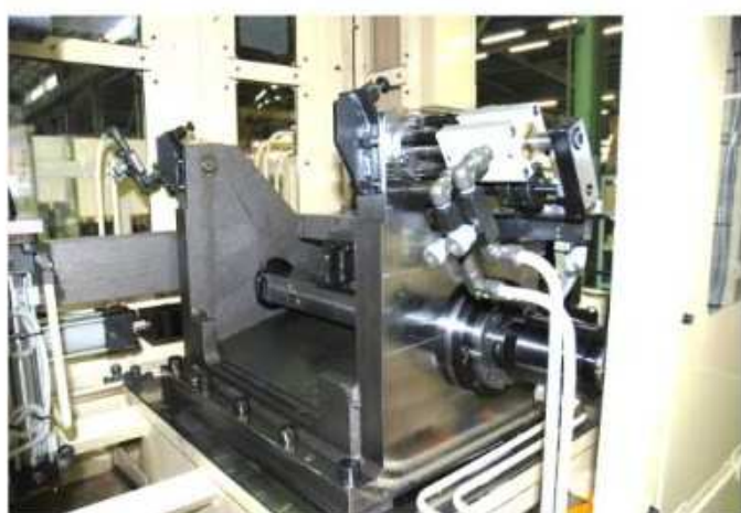
治具ティルティング装置