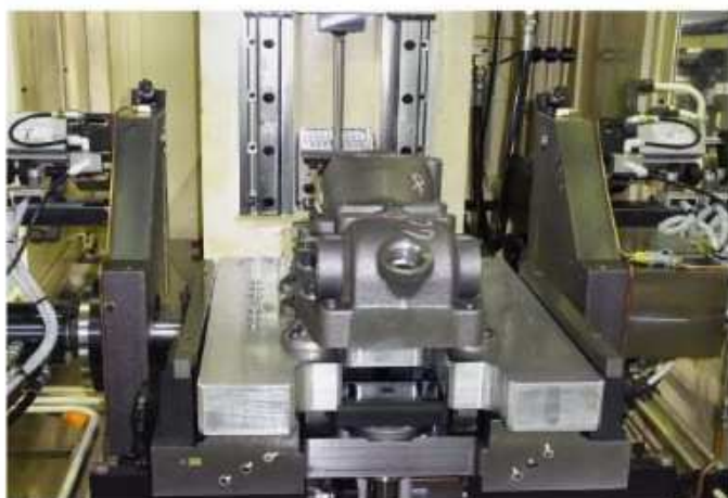
パレット治具上の加工物—正面