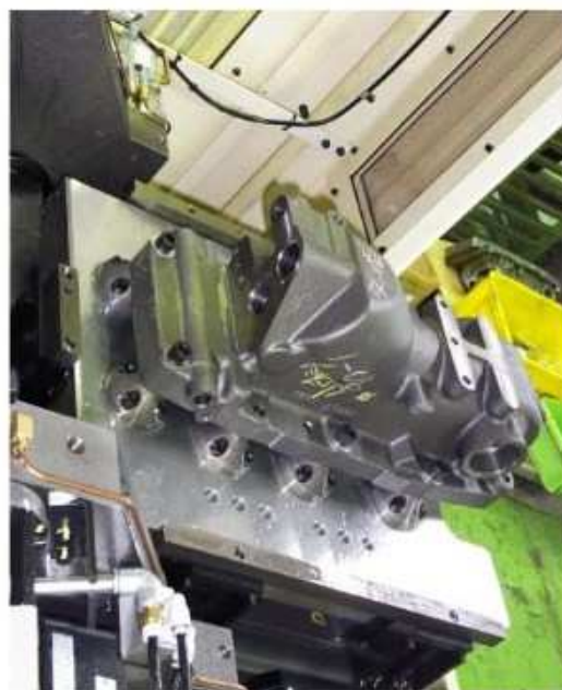
同じく作業部側より見る