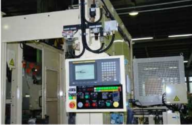
操作盤—機械正面右側に配置