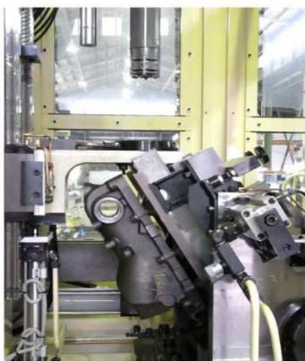
加工物とホーニング工具部