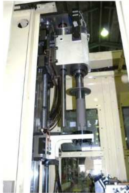
ヘッド部、砥石ガイド部—左側