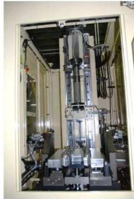
ホーニングヘッド部、パレット治具部