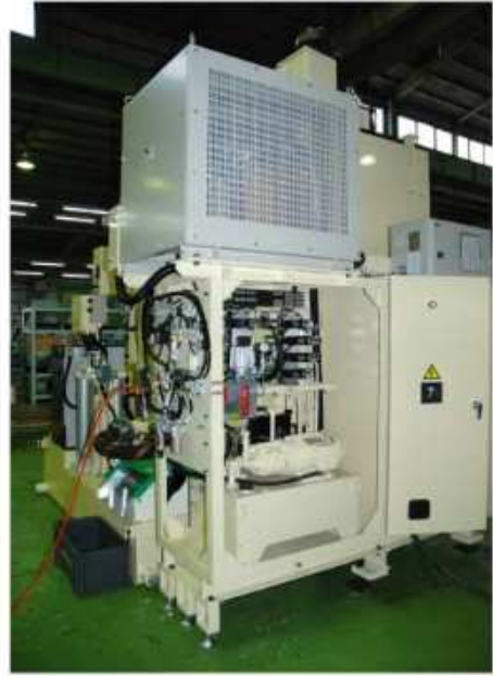
電源トランス—上側と油圧、空圧、潤滑装置