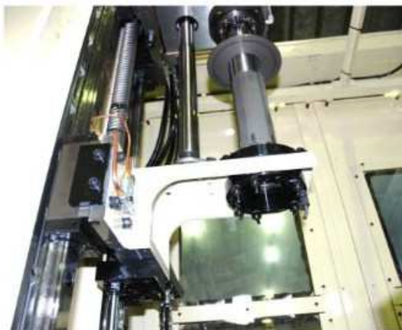
砥石ガイド部—クーラントノズル付き