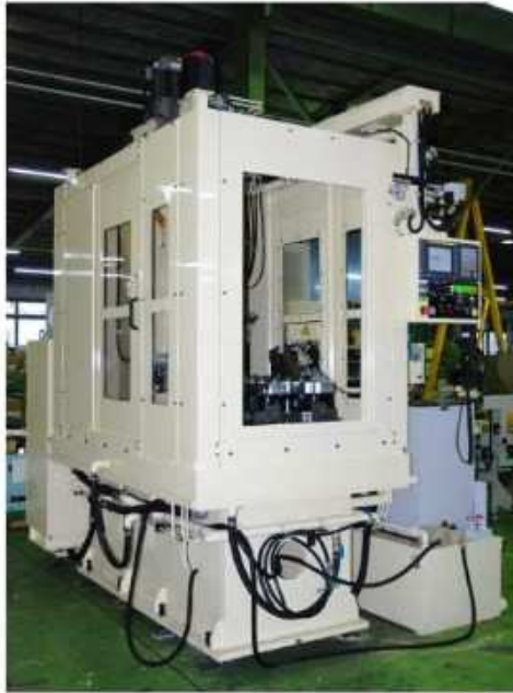
機械左側—砥石交換側