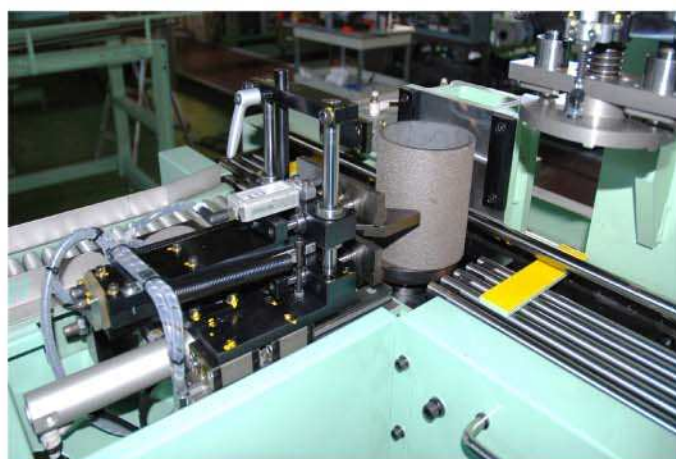
外径計測ステーション