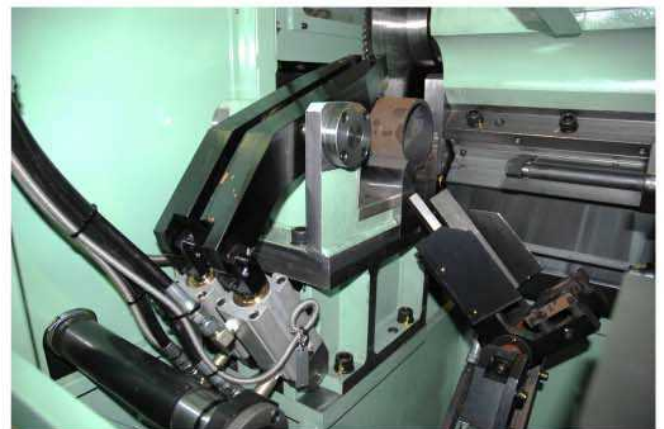
素材クランプ装置