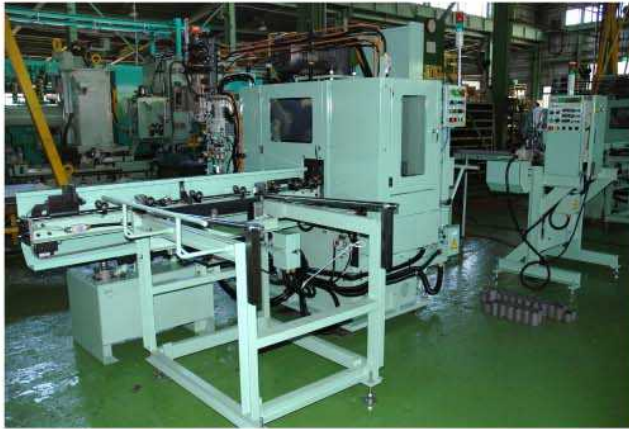
左側、切断機 右側、計測機