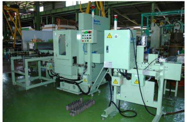
左側/切断機、右側/計測装置