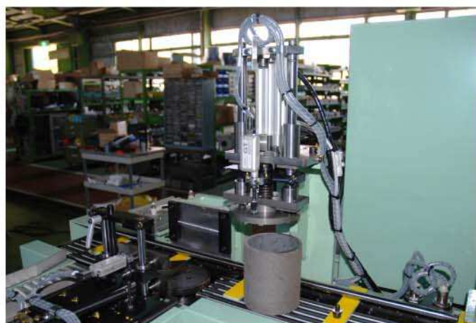
長さ計測ステーション