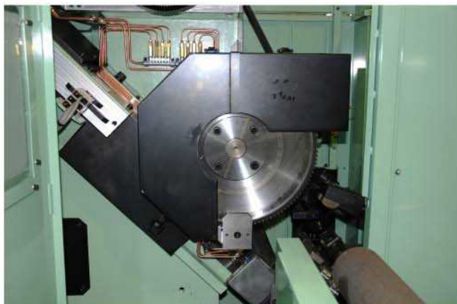
サーキュラー超硬チップソーΦ400×3.5mm