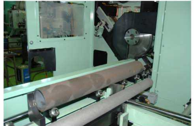
素材送り装置部と切断機ヘッド部