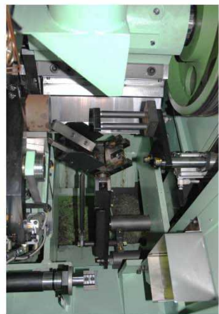
作業部—上側/ストッパー、中央/キャッチャー、 下側/送り出し装置