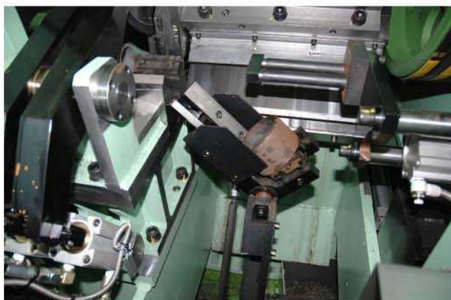
切断材キャッチャー