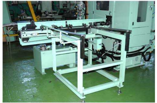
鑄造管素材マガジン