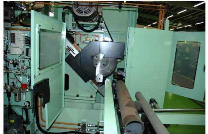
ヘッド、素材送り装置