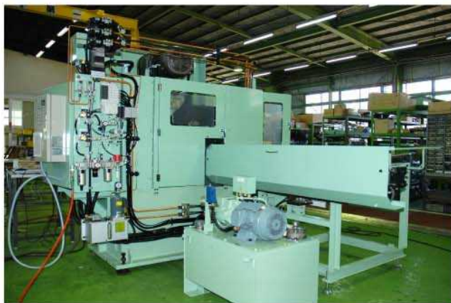
切断機左側後部－電気、空圧、潤滑、油圧制御装置