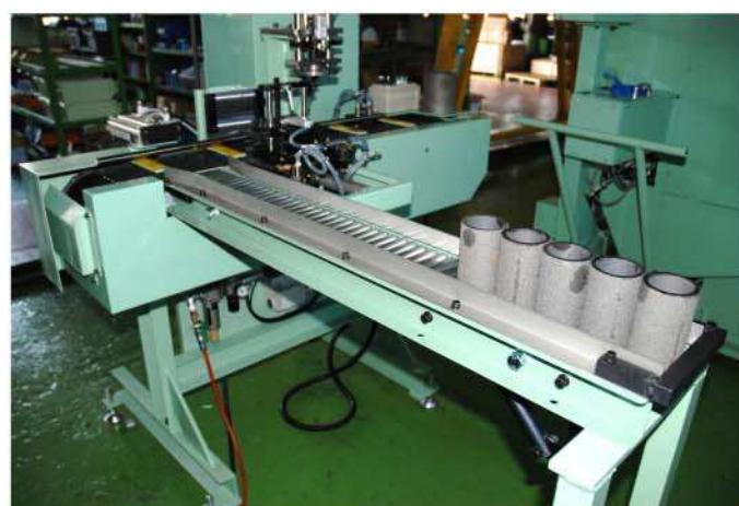
OK品搬出コンベヤー