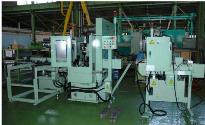
左側-切断機,右側-加工物計測装置

手動にて切断材を投入します。長さ、外径を自動にて計測後OK品、NG品を判別し別々に搬出します。