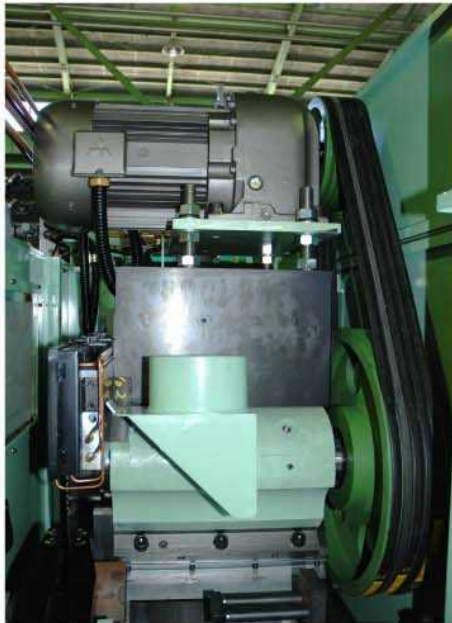
サーキュラーソーヘッド 7.5kw, 100rpm