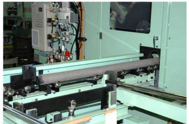
素材が送込まれる状態