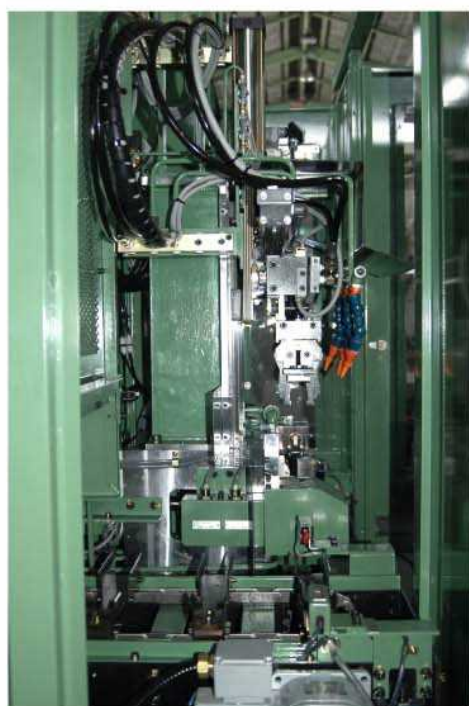
ハンド及びコンベヤー—搬出側