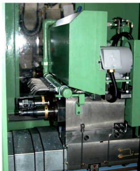
2軸ボーリングユニット