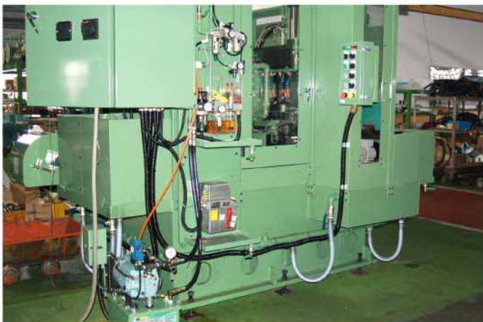
油圧、空圧、潤滑装置—左側