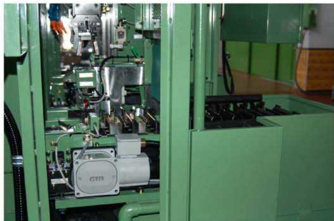
コンベヤー及びハンド—搬入側