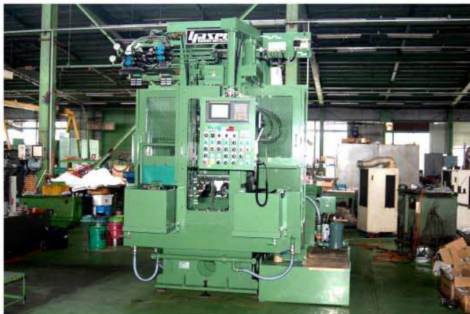
機械正面 左 搬入側 右 搬出側