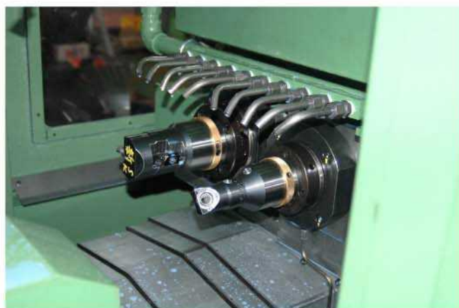
ボーリングヘッド