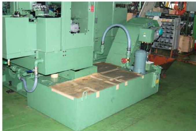
クーラントユニット—右側