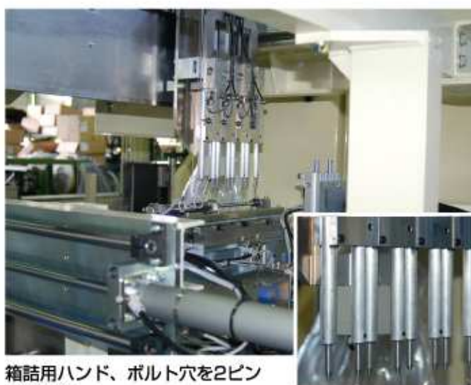
箱詰用ハンド、ボルト穴を2ピンにて保持