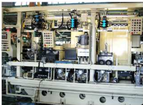
正面 OP-1 OP-2 OP-3 OP-4 OP-5 OP-6