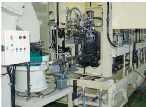
パーツフィーダー、搬入側