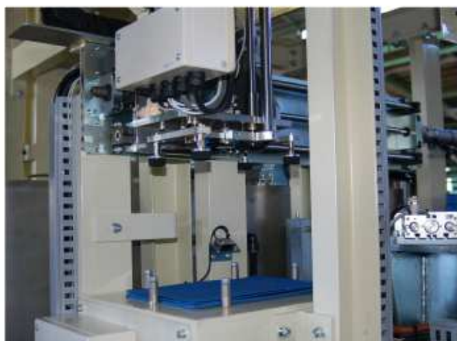
プラスチックシートセット用ハンド