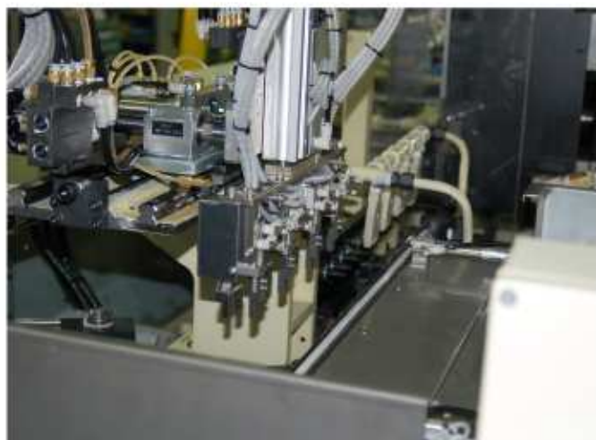
取り出しハンドと洗浄装置