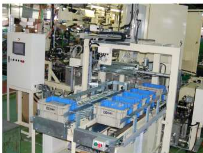
搬出側 箱搬送装置