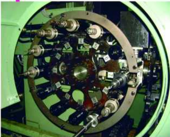
▲工具マガジン 12本収納 各々のスピンドルに付いています