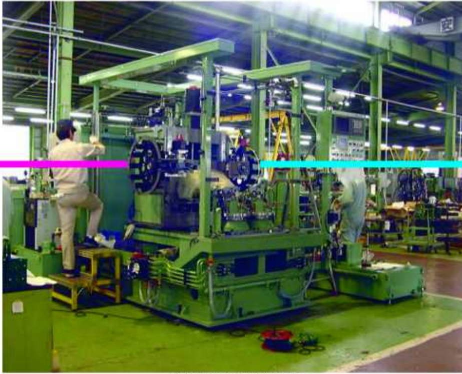
▲機械全体一組み立て風景